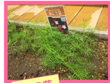
るこう草 星形のかわいいお花は大人気!

さといもは芽が 出るまでにすご 〜く時間がか かるけれど、 「信じて待つ」 ことを教えてく れます。じっくり 育ってますよ♪