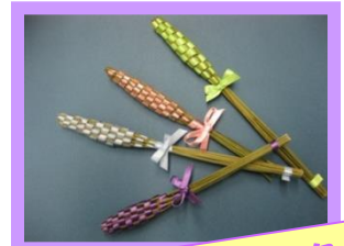
ラベンダースティック 初収穫の花茎でクラフト作りを 楽しみました♪