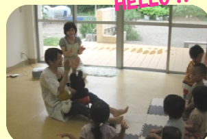
Row, row, row your boat♪