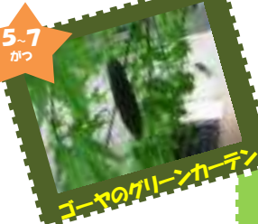
ゴーヤのグリーンカーテン