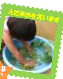
えだまめを洗います