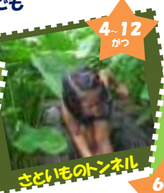
さといものトンネル